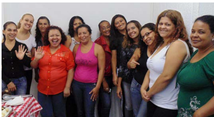
Treinamento das copeiras